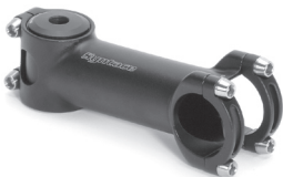
Syntace F 119 Der einzig wirklich durchdachte 31,8 Vorbau