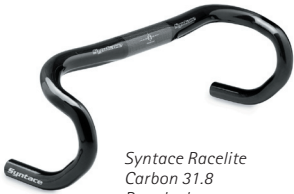
Syntace Racelite Carbon 31.8 Rennlenker

Wir gratulieren Ihnen zu Ihrem Syntace Racelite Carbon 31.8 Rennlenker. Bitte lesen Sie die komplette Montageanleitung, denn wir haben sehr wichtige Informationen und Praxistipps hineingepackt.